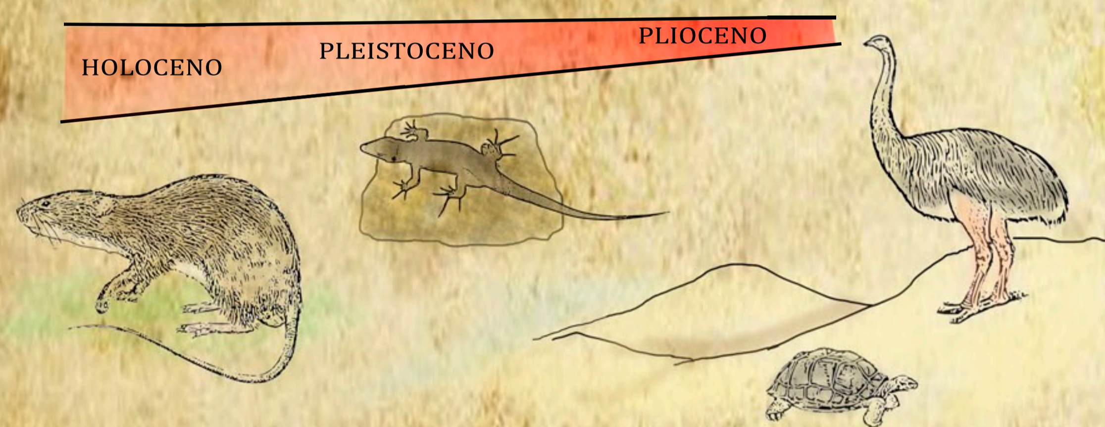
FIGURA 2. Representación temporal de algunos fósiles extintos canarios. De izquierda a derecha: Rata Canariomys , lagarto Gallotia , tortuga Geochelone y ave ratite/ Struthio .

Los restos fósiles de vertebrados más antiguos de Canarias pertenecen a un ave gigante no voladora de edad pliocena inferior (Lomoschitz et al., 2016). Se encontraron en una capa de calcarenita bioclástica de origen eólica próxima a Órzola, al norte de Lanzarote. Además se han encontrado huevos de tortugas terrestres, una vertebra de bovido y gasterópodos terrestres. Los restos más recientes datan de pocos miles de años, entre los que encontramos a las ratas gigantes del género Canariomys y con algo más de antigüedad a los lagartos gigantes Gallotia (Fig. 2).