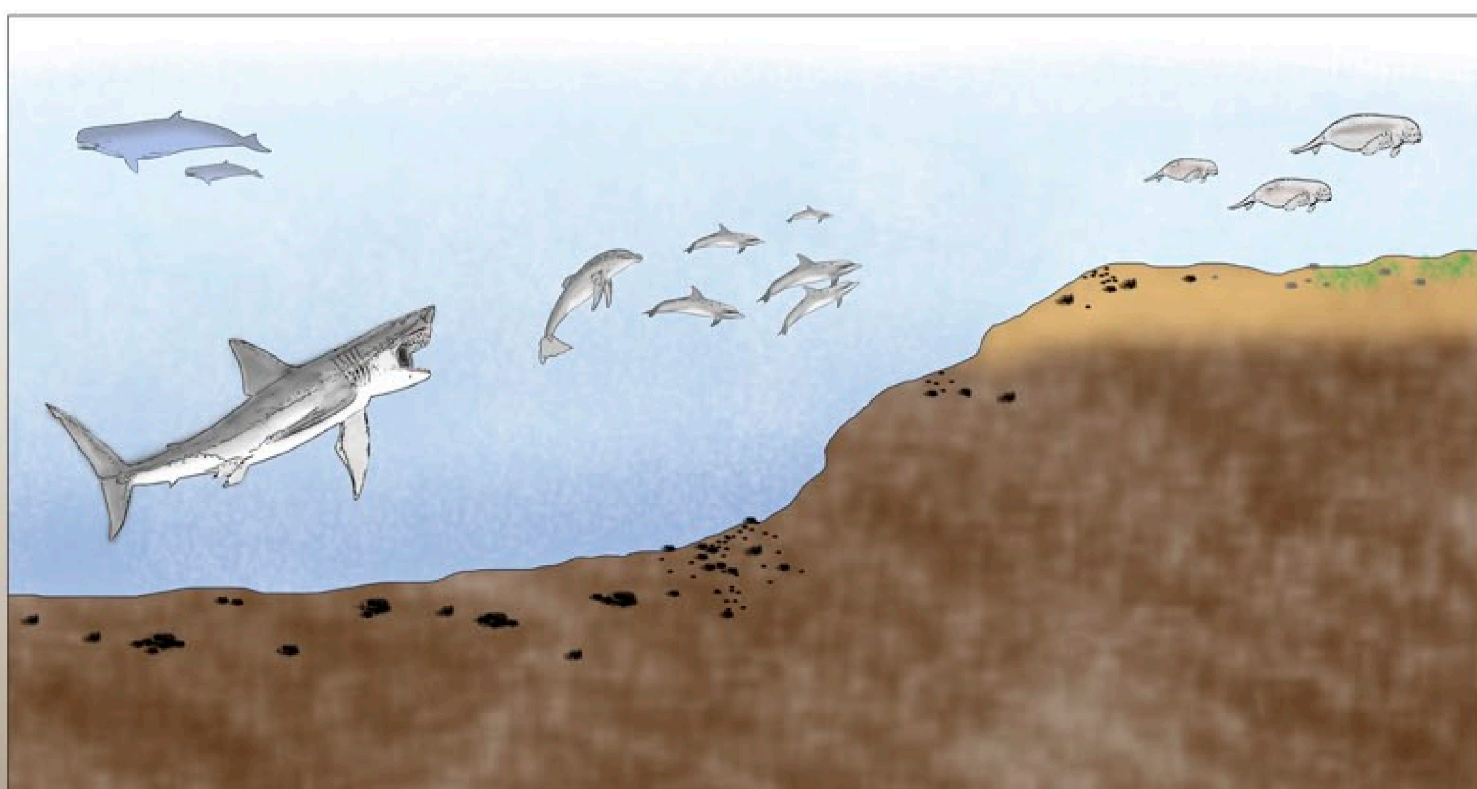
FIGURA 3. Reconstrucción de las especies fósiles citadas (de izquierda a derecha): cetáceos (misticetos), lamniformes ( Carcharodon megalodon ), cetáceos (odontocetos) y sirénidos ( Metaxytherium sp.).