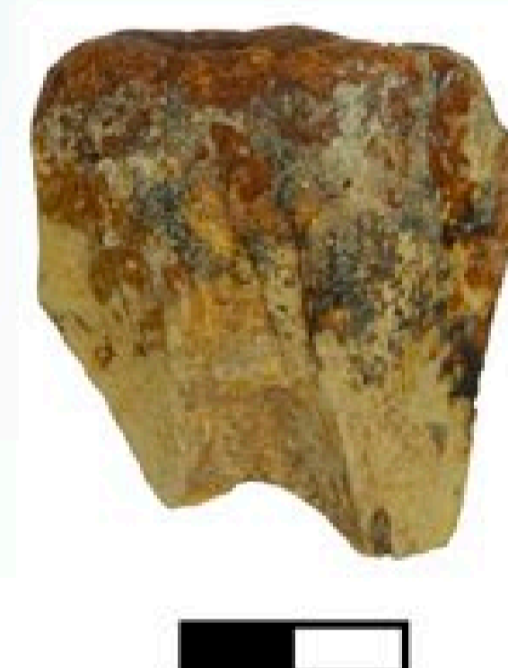
FIGURA 2. Diente fósil de Carcharodon megalodon . Colección de Meco Cabrera. Escala 2 cm.

Existen diferencias significativas entre los hábitos alimenticios de juveniles y adultos de C. megalodon (Fig. 2). Los juveniles se alimentaban principalmente de peces y tiburones pequeños. Al aumentar de talla pasaban a ser predadores preferenciales de mamíferos marinos (delfines, ballenas, focas, manatíes, entre otros), por lo que su registro fósil, al igual que para el actual Carcharodon charcharias , se asocia a poblaciones estables de mamíferos marinos. En Canarias se ha constatado la presencia fósil de restos de cetáceos encontrados tanto en el Banco de Concepción, al norte de la isla de La Graciosa (Lanzarote), como en depósitos fosilíferos subaéreos. Se encontró una pieza del oído que podría pertenecer a una orca o delfín, la cual actualmente podría estar extinta, y otros restos sin identificar. A parte de estos cetáceos se descubrieron fragmentos de un cráneo y una costilla de sirénido, posiblemente