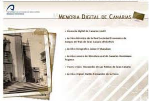
Portal Memoria Digital de Canarias

ria, el Cabildo de Lanzarote, la Universidad de Lanzarote, la Universidad de La Laguna, la Biblioteca Municipal de Santa Cruz de Teneri-