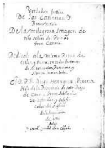
Verdadera fortuna de las Canarias y breue noticia de la milagrosa imagen de Ntra. Señora del Pino de Gran Canaria; dedicado a la misma Reina de los cielos y tierra...

hablan los canarios: refundición del léxico de Gran Canaria, un documento que versa sobre los modismos y vocablos de las islas. Al final contiene un pequeño diccionario, donde se incluyen términos pocos usados destinados a extinguirse en el tiempo.