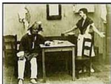
La hija del Mestre

simplemente ver documentales que se emitían en las televisiones públicas cuando los peninsulares se acercaban aquí para filmar nuestra riqueza cultural, etnográfica y paisajística siguiendo el boom del turismo, ejemplo de ello es algún que otro episodio de programas como "Nuestras Islas" o "Memoria de nuestras Islas".