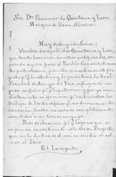
Proyecto remitido al Director de la Sociedad Económica para crear un partido que luche por los intereses de Gran Canaria