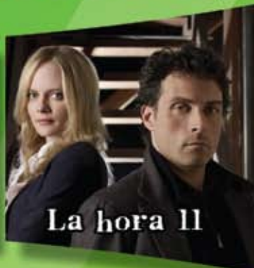
La hora 11